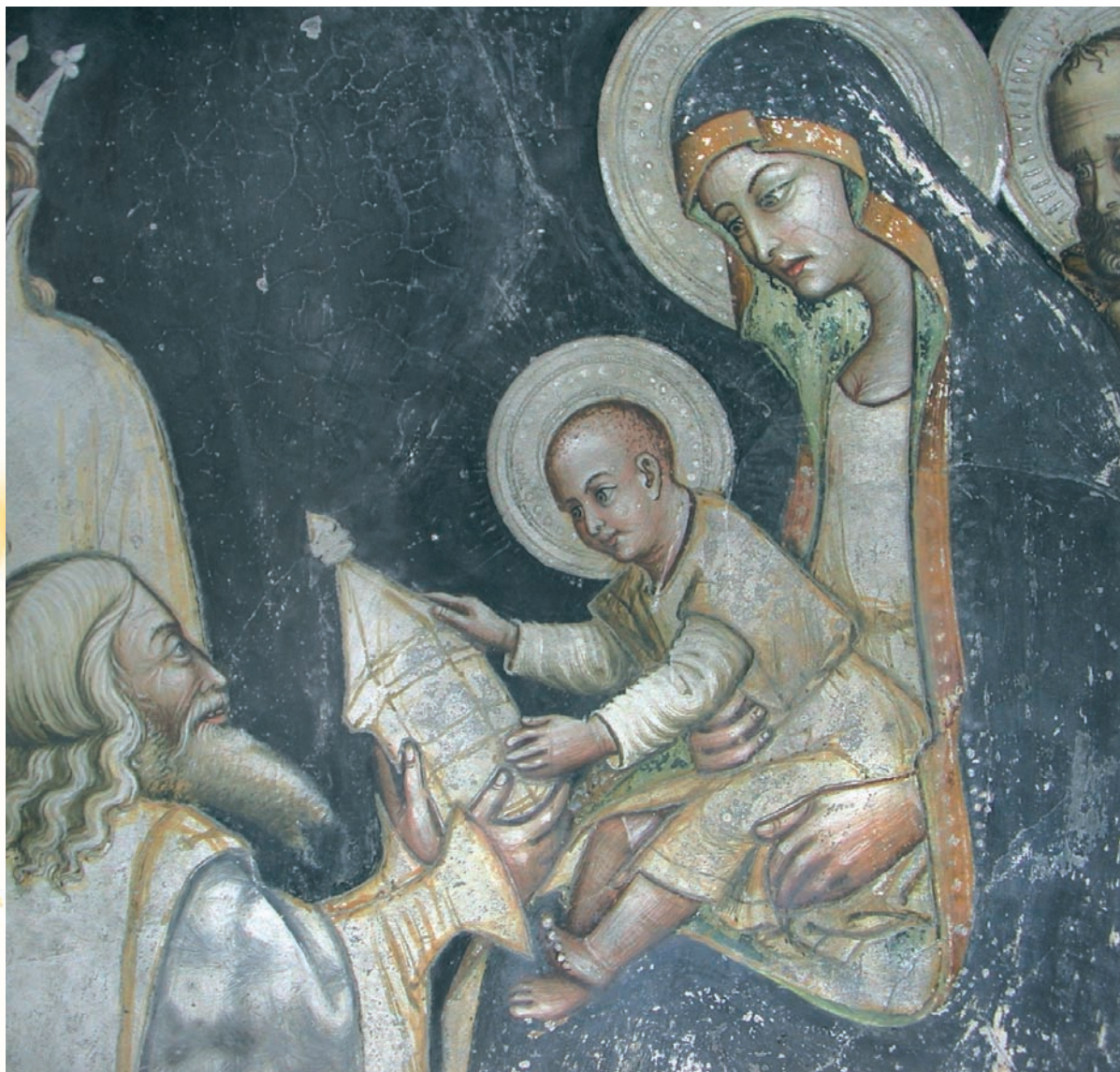
I Magi - Affresco Basilica Santa Caterina d'Alessandria