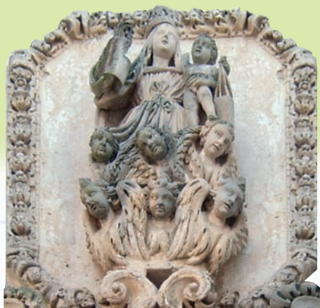
Chiesa del Carmine, facciata (part.)